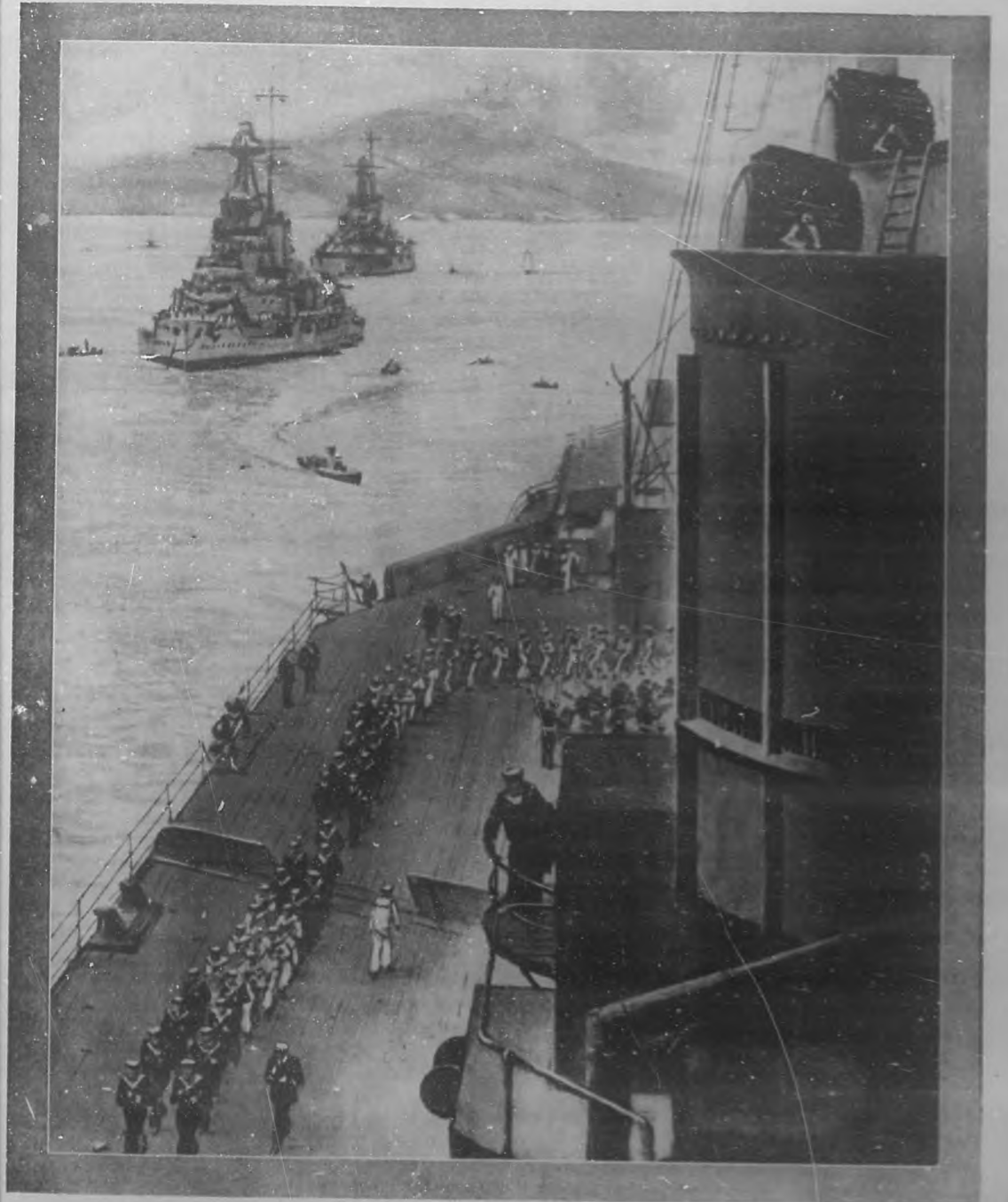
HACIENDO EJERCICIO.—La dotación de un poderoso acorazado inglés haciendo ejercicios en una de las cubiertas de la nave.