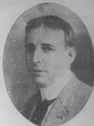
GUSTAVO ROBRENO Aplaudido artista del teatro "Alhambra", y escritor muy notable, que celebrará su función de honor el próximo martes en el teatro "Payret".

No quiere decir lo expuesto, que estuviera totalmente denudado de apasionamientos generalmente injustos, como se advierte en algunas de sus críticas contra el nuevo movimiento literario, asunto en el cual sus prejuicios de escuela lo arrastraron a lesionar la verdad y olvidar la justicia. El nombre de Emilio Bobadilla es un verdadero prestigio para Cuba. Cuantiosas obras en prosa y verso ha legado a las letras nacionales, obras que pregonan en todas partes la rica intelectualidad de un escritor de los más grandes de nuestra época.