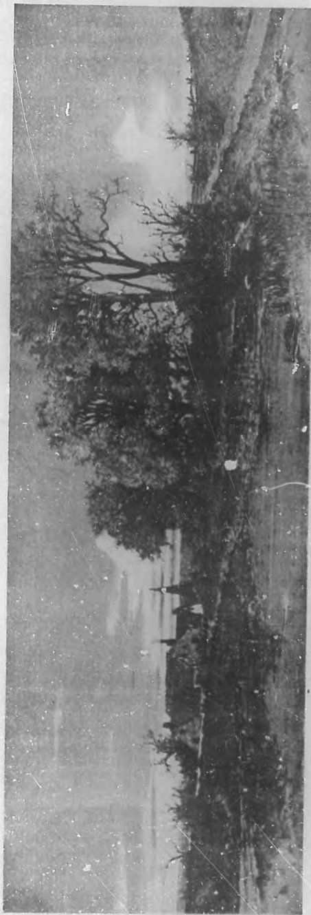
(Grabado tricolor de BOHEMIA.)